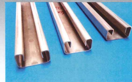
マグネシウムのプレスによる曲げ加工

可能性を検証してきた。それは「厚さ1.4mmのマグネシウム合金の板材をレール形状に加工する」という課題。マグネシウム合金をプレ